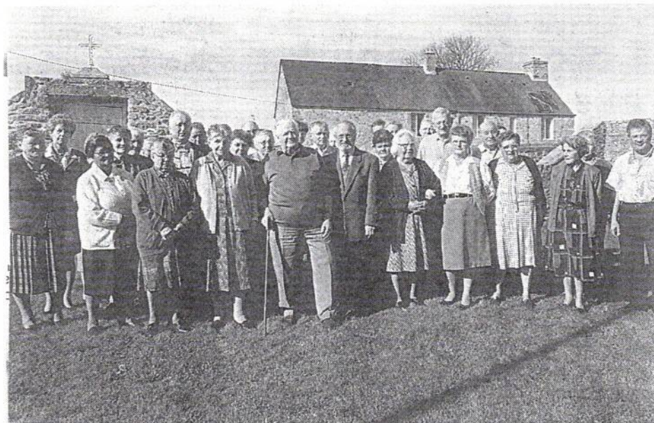
La photo de famille avant de passer à table.