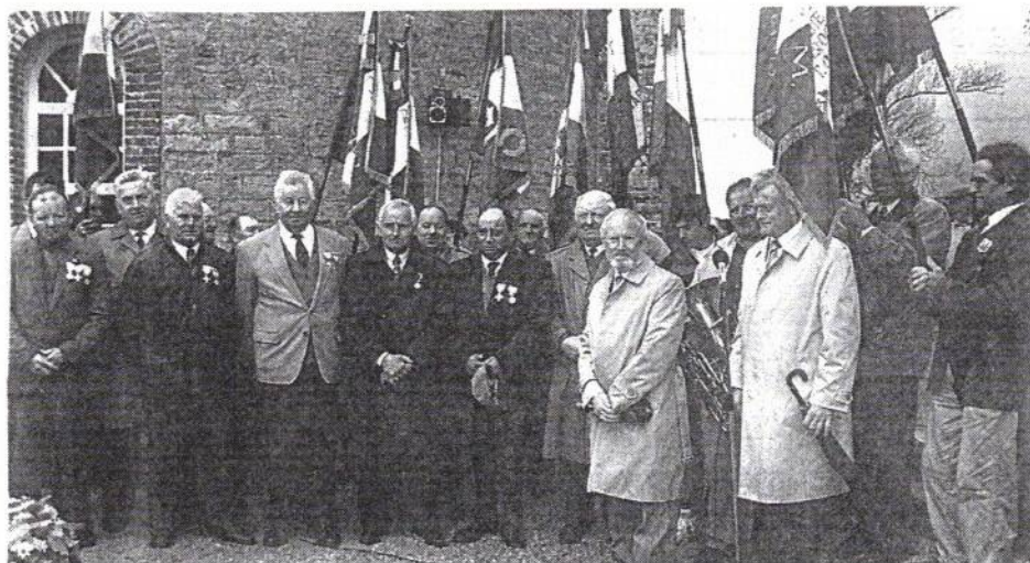
L'ensemble des décorés à l'issue de la cérémonie patriotique.