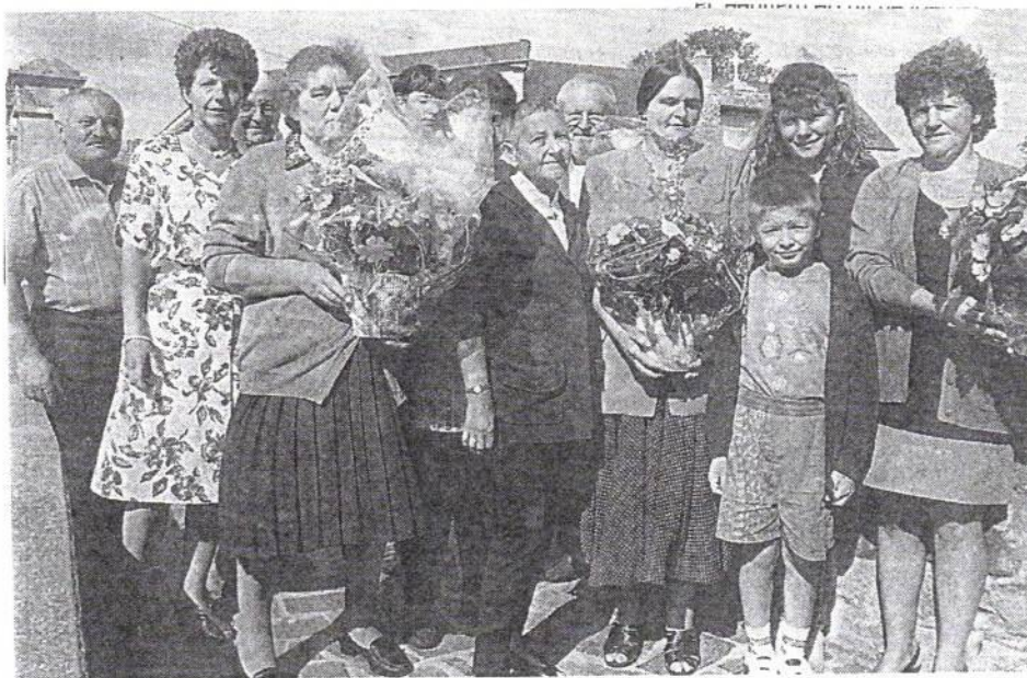
Les lauréats entourés du jury et des élus.